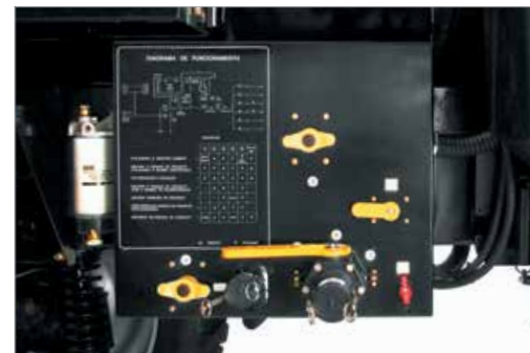
Central de abastecimento