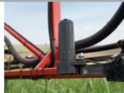
Sensor automático de altura

Dois sensores localizados em cada lado da barra (LD e LE) e um outro localizado na parte central permitem uma regulagem automática e rápida da altura da barra, proporcionando uniformidade na aplicação e maior proteção contra impactos.