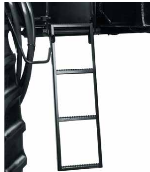
Escada de acesso ao motor