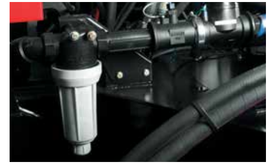
Filtro principal, fluxômetro e válvula