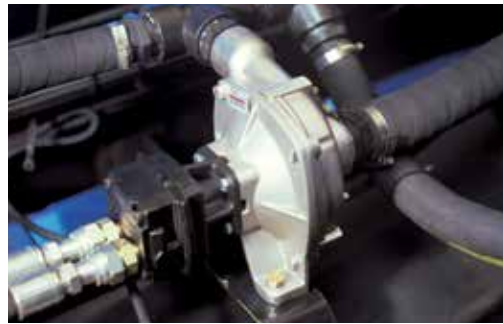
Bomba centrífuga de aço inoxidável

O projeto do Patriot 350 é direcionado para a alta produtividade. Seu tanque de produtos dispõe de 3.500 litros de capacidade. Seus dois tanques de água limpa totalizam 385 litros e são intercomunicáveis e localizados um em cada lado do pulverizador, para a melhor distribuição do peso. A bomba de pulverização é centrífuga e confeccionada com aço inox de alta resistência à corrosão. A válvula de controle da vazão é do tipo esférica, que garante maior precisão no controle de menores vazões.