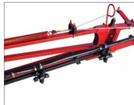
Sistema de desarme das pontas