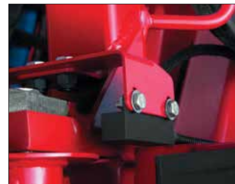
Sensor do sistema de centralização automática das barras