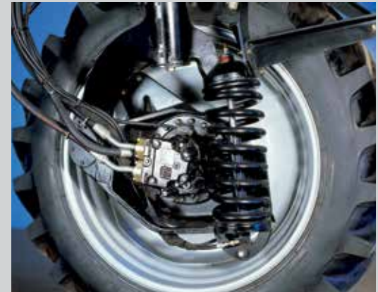
Suspensão hidráulica ativa

Design da suspensão: a suspensão ativa, além de reagir de forma específica a cada situação encontrada, possui um design que absorve com eficiência os impactos verticais e horizontais, evitando que eles sejam transferidos para o chassi, barras e cabine.