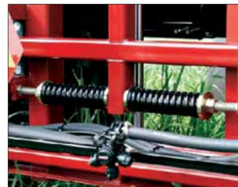
Molas de estabilidade reforçadas