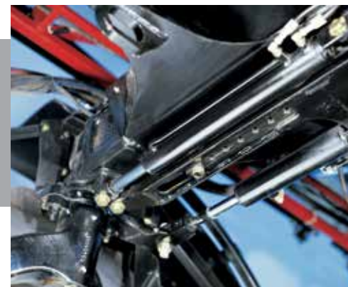
Sistema de abertura de bitola