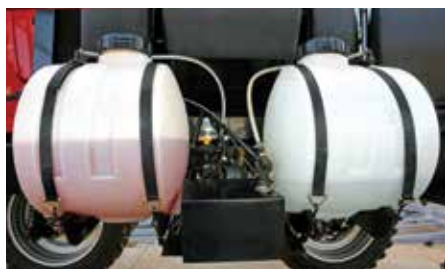
Tanques de injeção direta